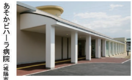
あそかビハラ病院(城陽市)