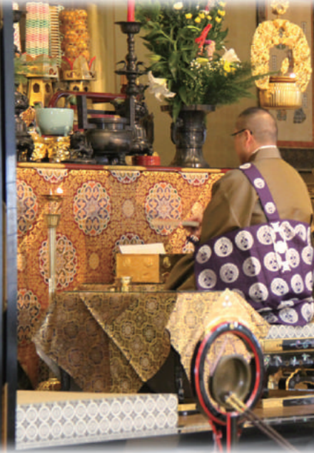
鷺森別院報恩講(内陣出勤法中はお揃いの色衣を着用します)

各地におけるお念仏の中心道場として別院が全国に設置されており、通常、本山の報恩講に先立ち、秋から冬頃にかけて「報恩講」をお勤めしています。