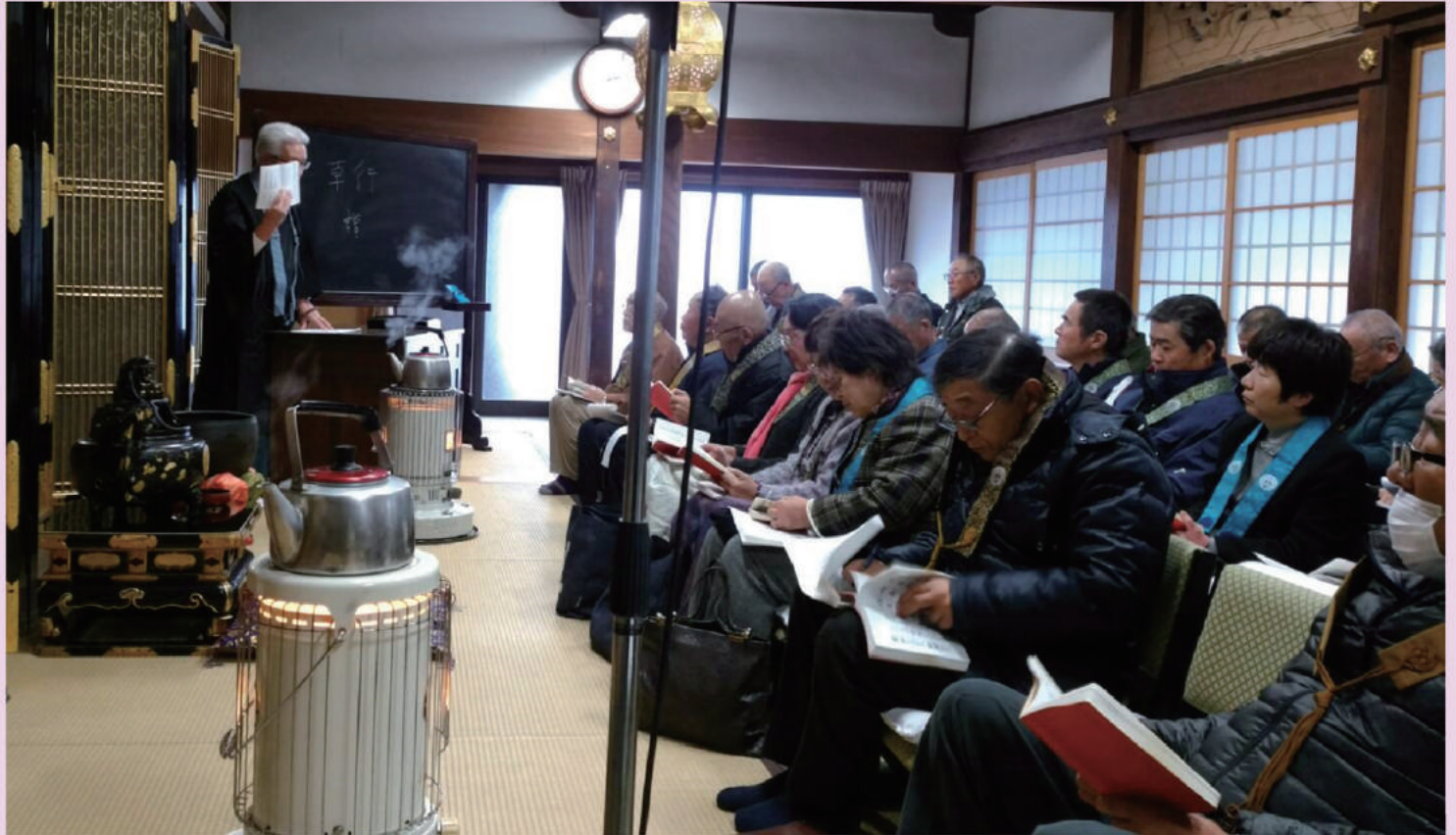
正信偈のおつとめ(勤式指導)を受けました(日高組総代会後期研修会)

2018(平成30)年 3月1日 発行 浄土真宗本願寺派 和歌山教区日高組 責任者 藤本使朗