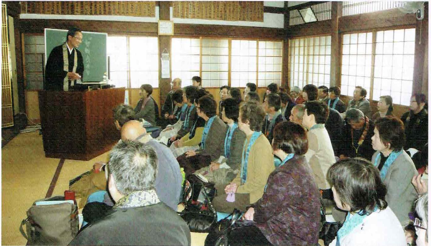
第21回 日高組真宗法座（即生寺）