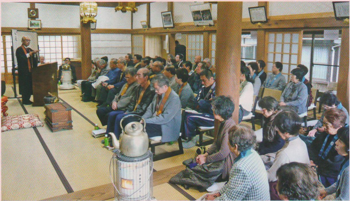
第20回 日高組真宗法座